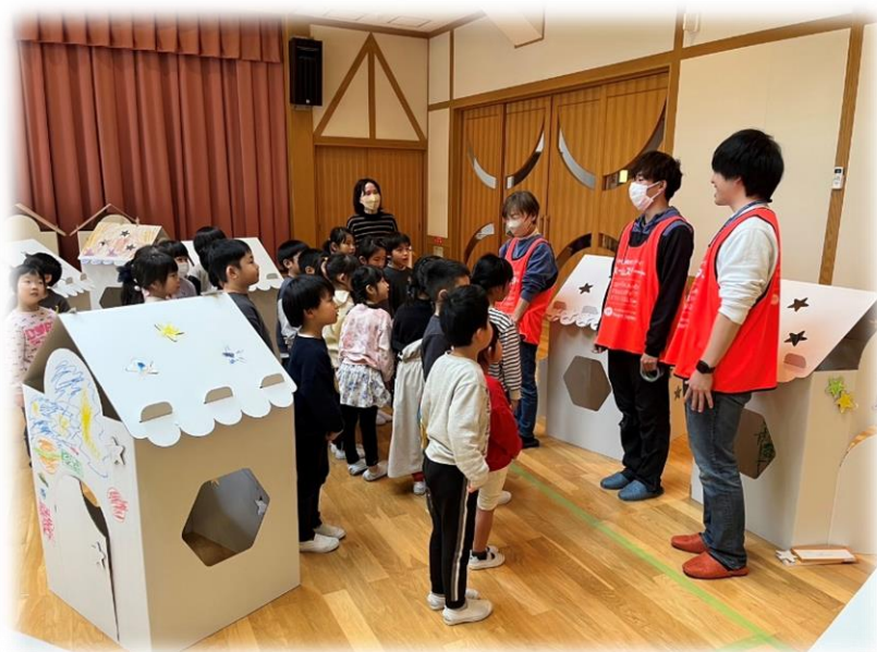
2月9日 被災地（七尾）へ物資を届けました